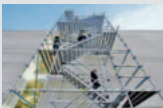
Лестницы, рабочие платформы